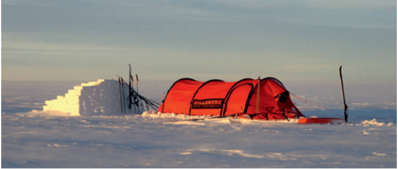
Sieht es morgens auf der Grönlandexpedition 2008 noch nach einen wunderschönen Tag aus, kommt gegen Mittag ein starker Wind auf.